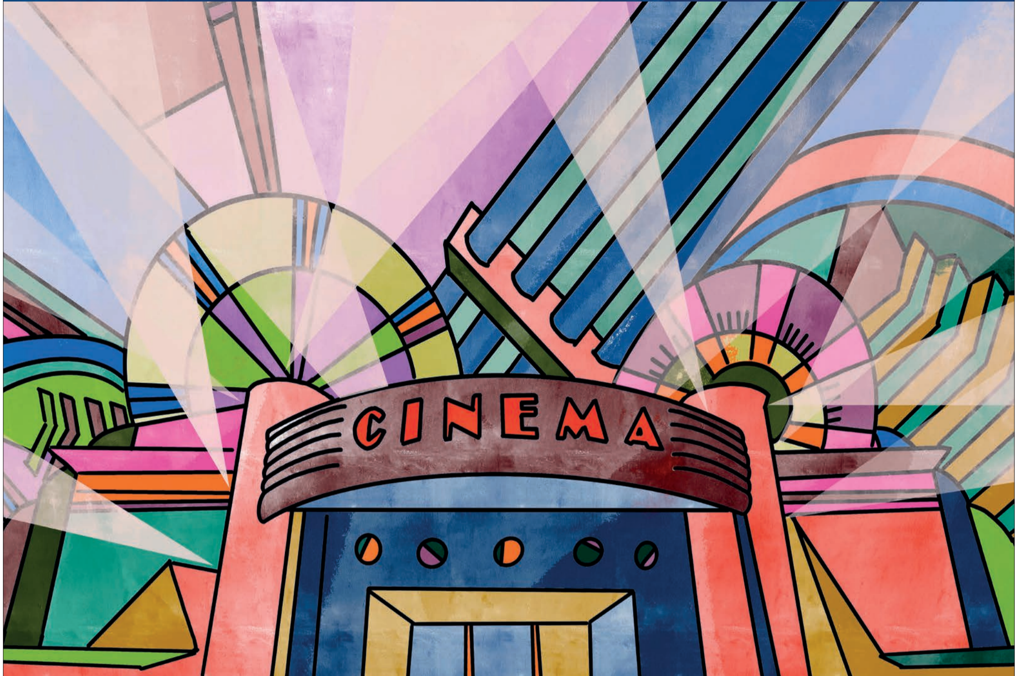
Illustrazione Florence Di Benedetto